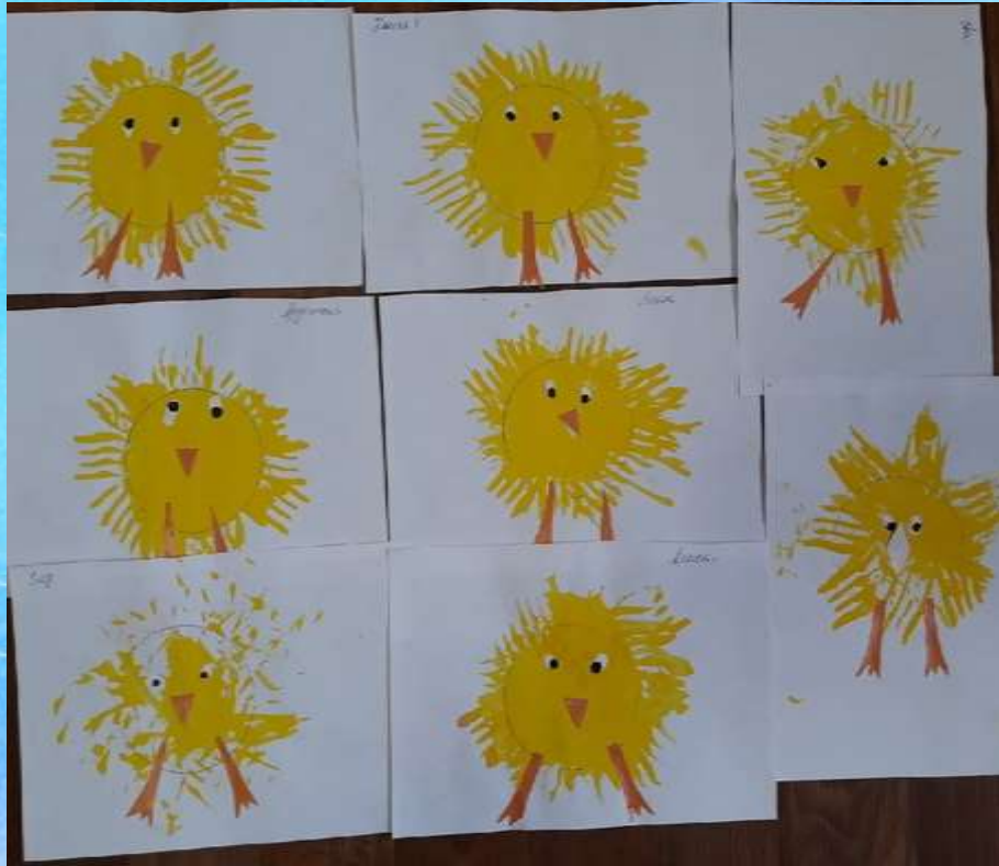
Рисование с помощью вилки «Цыпленок»