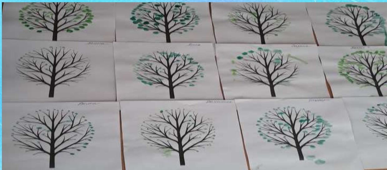
Рисование ватными палочками «Первые листочки»