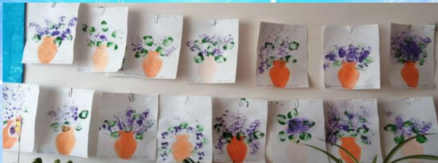
Рисование мятой бумагой «Сирень»