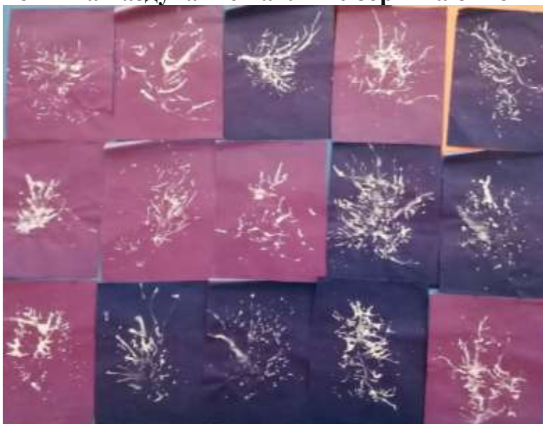
Рисование ватными палочками «Первые листочки»