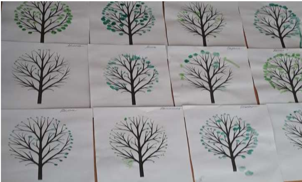
Рисование мягкой бумагой «Сирень»